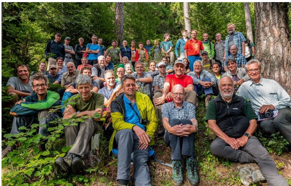
Abb 4 Gruppenfoto der GWG-Sommertagung 2021.

Bei der Weiterentwicklung der MP zu NaiS (Nachhaltigkeit und Erfolgskontrolle im Schutzwald) Anfang der 2000er-Jahre (Frehner et al 2005) können sich die Autor/innen auf die Ergebnisse früherer GWG-Tagungen stützen. An dieser Arbeit sind zahlreiche weitere GWG-Mitglieder beteiligt.