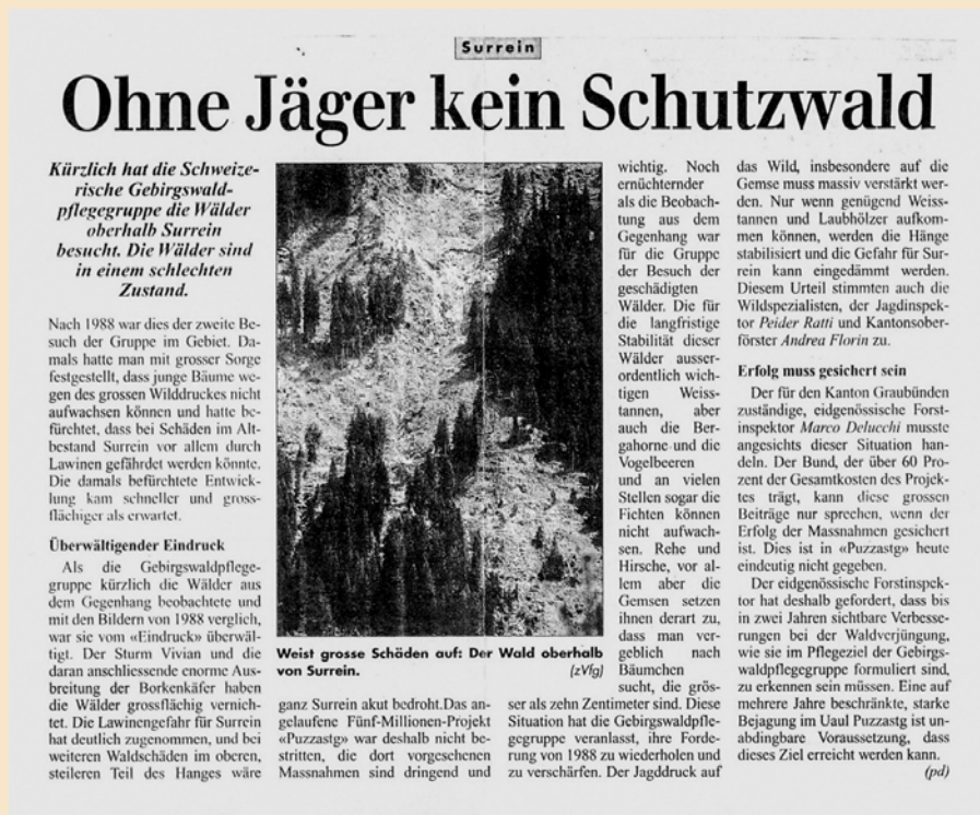
Abb 2 Zeitungsbericht aus dem «Bündner Tagblatt» (1997).

Ein eindrückliches Beispiel hierfür ist der Uaul Puzzastg in Sumvitg: Bereits bei den GWG-Tagungen 1988 und 1997 wurden eine hohe Verjüngungsdringlichkeit und ein zu starker Verbiss festgestellt (Abbildung 2). 1988 war der ganze Hang von funktionierendem Schutzwald bedeckt. Seither entstanden durch Störungen viele Lücken, und wegen mangelnder Verjüngung wurden für mehrere Millionen Franken Lawinerverbauungen erstellt. Ein Teil der temporären Werke musste inzwischen bereits ersetzt werden, weil sich wildbedingt kein Verjüngungserfolg einstellt. Als letzter Ausweg soll nun 2025 ein Zaun, der 25 ha umspannt, mit Kosten von 1.4 Millionen Franken erstellt werden, um endlich Verjüngung zu ermöglichen (Abbildung 3).